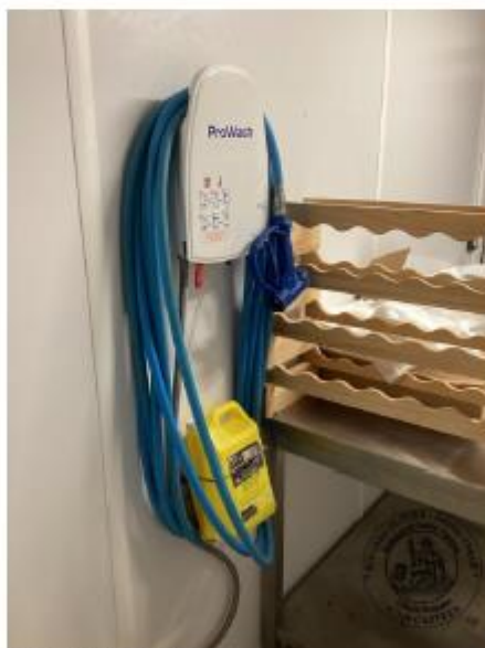
62. (26/09/2025 09:52:19) GPS : Latitude=43.70618, Longitude=-2.13788, Altitude=292.70 m, Angle:345.30° Précision verticale=5.82m, Précision horizontale=6.54m, Heure GMT=2025-09-26 07:52:18.