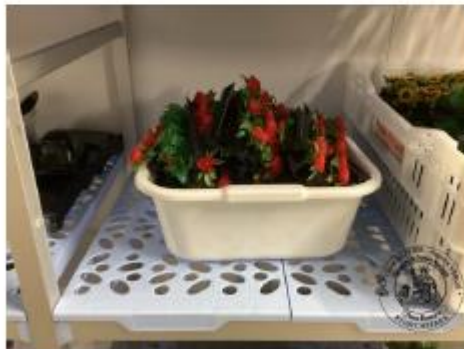
52. (26/09/2025 09:51:40) GPS : Latitude=43.70623, Longitude=-2.13788, Altitude=291.84 m, Angle=33.98° Précision verticale=6.61m, Précision horizontale=6.54m, Heure GMT=2025-09-26 07:51:39.