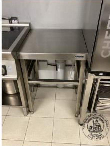
43. (26/09/2025 09:46:26) GPS : Latitude=43.70622, Longitude=-2.13786, Altitude=292.29 m, Angle:20.07° Précision verticale=5.91m, Précision horizontale=6.59m, Heure GMT=2025-09-26 07:46:25.