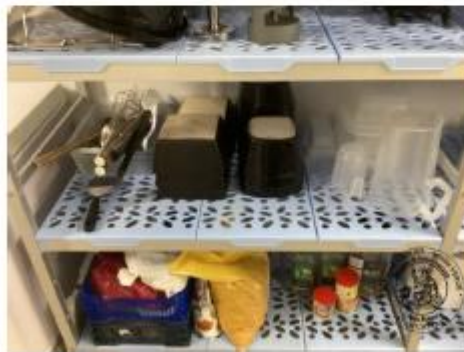
54. (26/09/2025 09:51:46) GPS : Latitude=43.70622, Longitude=-2.13789, Altitude=292.16 m, Angle:32.13° Précision verticale=6.32m, Précision horizontale=6.61m, Heure GMT=2025-09-26 07:51:46.