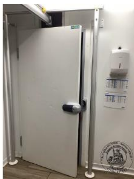
23. (26/09/2025 09:32:02) GPS : Latitude=43.70624, Longitude=-2.13788, Altitude=292.84 m, Angle:153.02° Précision verticale=5.31m, Précision horizontale=6.20m, Heure GMT=2025-09-26 07:32:01.