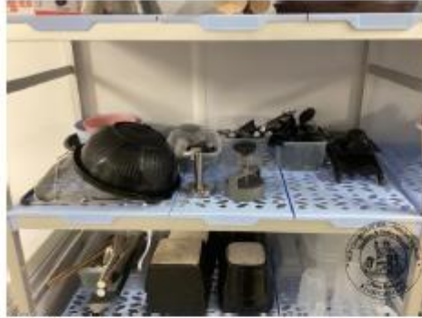
53. (26/09/2025 09:51:45) GPS : Latitude=43.70622, Longitude=-2.13789, Altitude=292.06 m, Angle:32.13° Précision verticale=6.07m, Précision horizontale=6.55m, Heure GMT=2025-09-26 07:51:44.