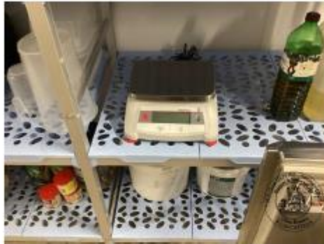
51. (26/09/2025 09:51:38) GPS : Latitude=43.70623, Longitude=-2.13786, Altitude=292.02 m, Angle=33.98° Précision verticale=6.58m, Précision horizontale=6.61m, Heure GMT=2025-09-26 07:51:37.