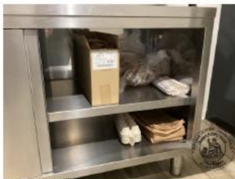
61. (26/09/2025 09:54:56) GPS : Latitude=43.70626, Longitude=-2.13783, Altitude=291.71 m, Angle:25.06° Précision verticale=7.05m, Précision horizontale=6.62m, Heure GMT=2025-09-26 07:54:56.