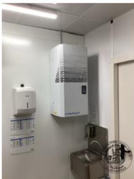
22. (26/09/2025 09:31:20) GPS : Latitude=43.70624, Longitude=-2.13787, Altitude=292.20 m, Angle:194.58° Précision verticale=4.94m, Précision horizontale=6.08m, Heure GMT=2025-09-26 07:31:20.