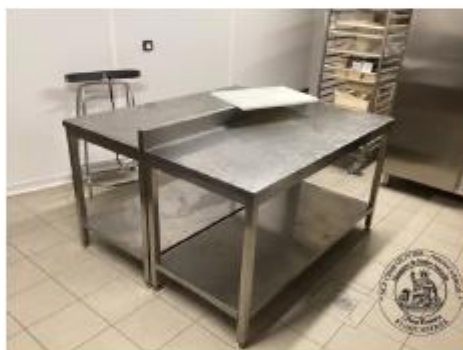
36. (26/09/2025 09:40:56) GPS : Latitude=43.70619, Longitude=2.13786, Altitude=292.53 m, Angle:162.73° Précision verticale=6.11m, Précision horizontale=6.66m, Heure GMT=2025-09-26 07:40:55.

n°25 1 ex. Four électrique UNOX Cheftop type GN1/1 Mixte 7 niveaux Avec supports latéraux