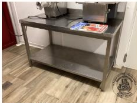
19. (26/09/2025 09:28:29) GPS : Latitude=43.70625, Longitude=2.13792, Altitude=292.73 m, Angle:346.92° Précision verticale=6.25m, Précision horizontale=6.28m, Heure GMT=2025-09-26 07:28:28.