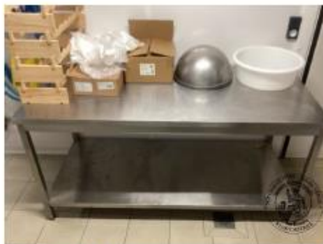
35. (26/09/2025 09:40:46) GPS : Latitude=43.70621, Longitude=2.13786, Altitude=292.46 m, Angle:193.66° Précision verticale=7.67m, Précision horizontale=6.75m, Heure GMT=2025-09-26 07:40:45.

n°24 3 ex. Tables inox 1600x700 Avec dossier et étagère basse