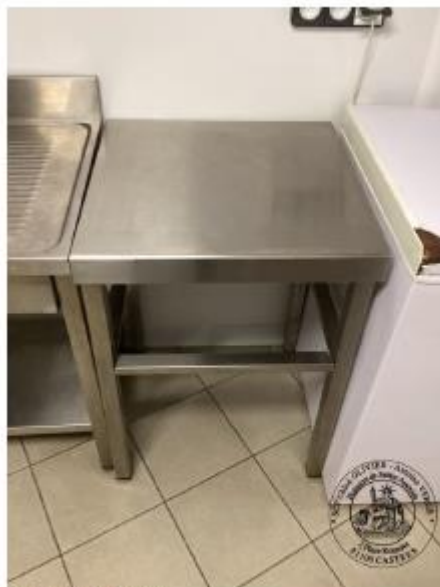
44. (26/09/2025 09:46:36) GPS : Latitude=43.70620, Longitude=-2.13788, Altitude=292.72 m, Angle:154.92° Précision verticale=6.02m, Précision horizontale=6.53m, Heure GMT=2025-09-26 07:46:35.