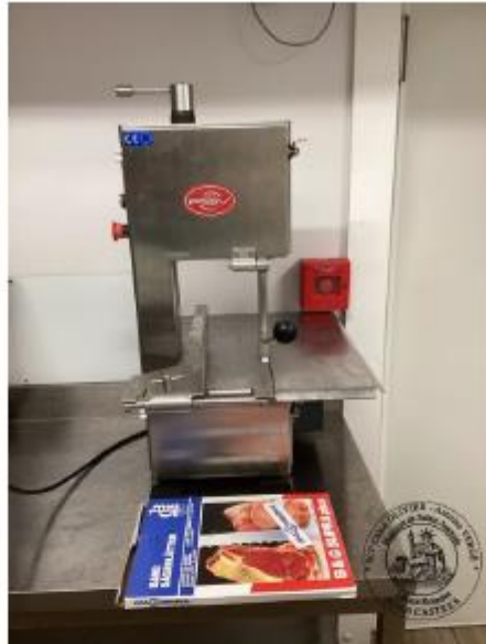
18. (26/09/2025 09:28:00) GPS : Latitude=43.70619, Longitude=2.13785, Altitude=292.39 m, Angle:107.56° Précision verticale=5.14m, Précision horizontale=5.82m, Heure GMT=2025-09-26 07:28:00.